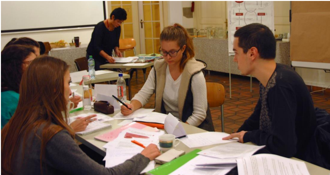
Participants en train de travailler sur un cas réel donné en exercice lors de la formation du 26 octobre au 1 er novembre 2016.

De plus, depuis 2016, ASF propose une formation en gestion de projet à toutes personnes souhaitant se destiner à une carrière dans le milieu de la coopération internationale ou de l'aide au développement, ainsi qu'à toutes personnes désireuses de maîtriser un outil efficace de conception et de planification. Elle est basée sur la méthode du cadre logique « FORA » (Finalités, Objectifs, Résultats, Activités) qui peut être appliquée à tous types de projets.