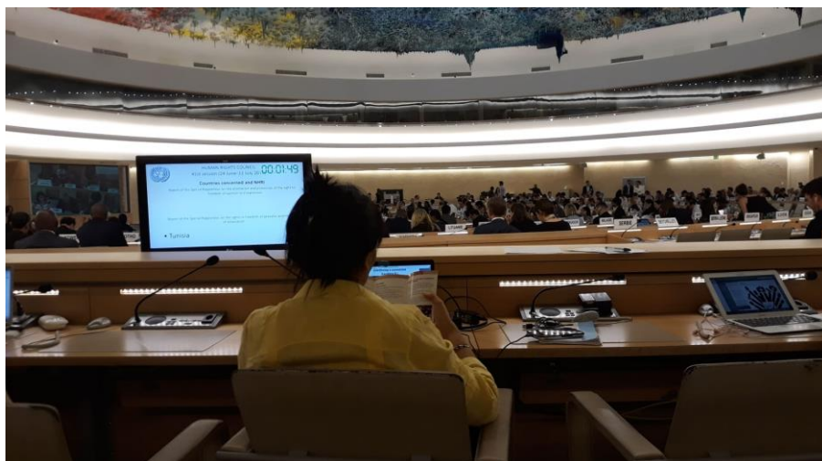
juin 2018

Session du droit à l'éducation lors du Conseil des droits de l'Homme