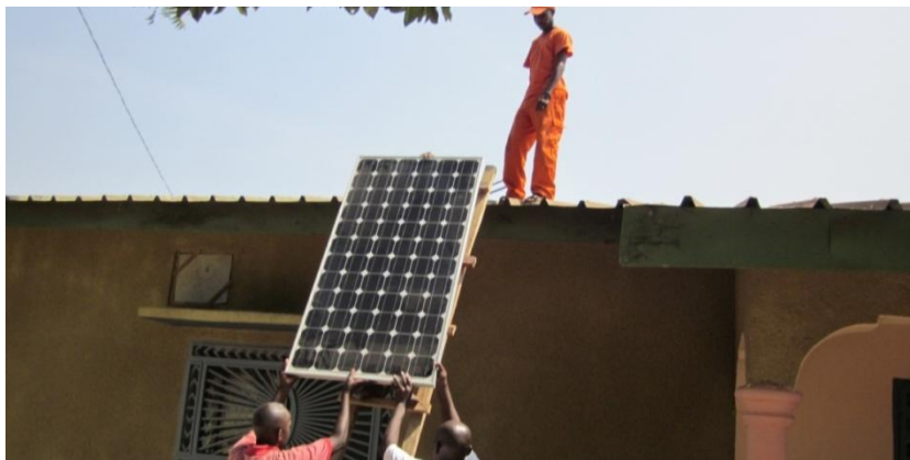
Installation des panneaux photovoltaïques à Matoto

Dans ce contexte, ASF a mis sur pied un projet pilote à Conakry en Guinée. Une salle informatique a été inaugurée dans le centre multifonctionnel de Matoto en octobre 2012 et le renforcement du système photovoltaïque a été fait en décembre 2012. De plus, une deuxième salle est en création dans le collège de Matoto. Ces deux projets constituent la phase pilote du programme et permettent de montrer l'efficacité de telles structures pour les bénéficiaires dans ces pays. SolarNetAfrica est encore en cours de recherche de financement. ASF a obtenu des équipements informatiques de la part de la Ville de Lausanne, de la Mission permanente du Canada, du CICR, d'Aprenas Bâle et d'autres partenaires. En 2012, ASF a établi une convention avec l'ENAM en vue de promouvoir le projet dans les pays cibles.