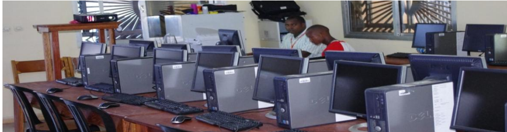
Centre multimédia à Matoto en République de Guinée

décembre 2012. Ainsi, de nouveaux équipements informatiques ont été acquis et un programme de formation a été élaboré. Le centre multimédia est fonctionnel et accueille les jeunes motivés à s'initier aux nouvelles techniques informatiques. Ce projet pilote est donc une réussite et nous permet maintenant de nous lancer dans un projet plus vaste afin que davantage de jeunes, notamment des écoliers, soient formés aux nouvelles technologies.