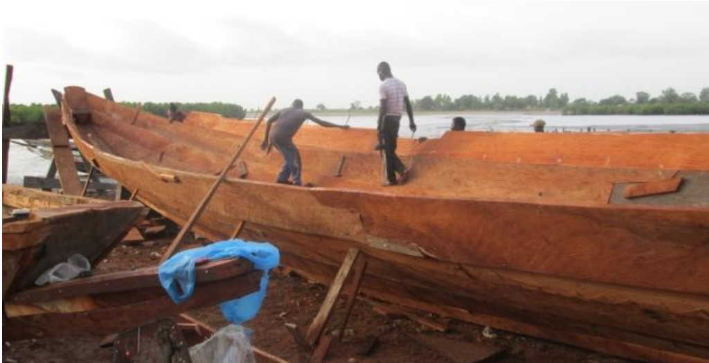
Construction de la pirogue en Sénégal

que Bonfi, Coyah, Kassa et Kamsar), permet de diffuser les outils et les habitudes de pêche responsable à travers un transfert de connaissances Sud/Sud. Il s'agit d'assurer une biodiversité qui préserve la culture spécifique des habitants des côtes. Grâce à la contribution financière du service de la solidarité internationale du Canton de Genève, ce projet a pu démarrer au cours de l'été 2012. Une équipe guinéenne s'est rendue au Sénégal pour construire une première pirogue avec l'aide de charpentiers sénégalais. La première pirogue-école a été construite et transférée en Guinée. Le programme de formation de pêche responsable a été conceptualisé.