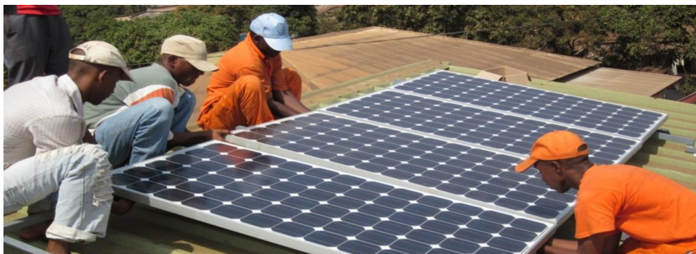
Position des panneaux photovoltaïques