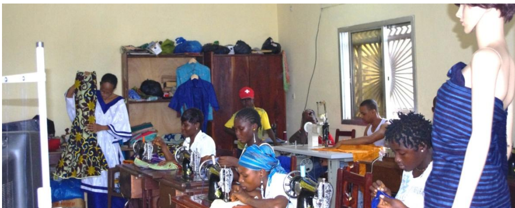
Centre de couture à Matoto en octobre 2012

Le centre offre une formation en broderie et couture selon un programme progressif pouvant être suivi en continu ou sous forme de modules spécialisés. Le projet à court terme est de former 10 jeunes filles par an. Le centre a déjà été construit et les premières filles sont actuellement en formation.