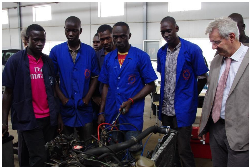
juillet 2015.

Les points suivants de ce projet ont été réalisés depuis 2015 en partenariat avec le DFAE, le canton de Vaud, l'IFFP et le Ministre de la formation professionnelle, de l'apprentissage et de l'artisanat du Sénégal.