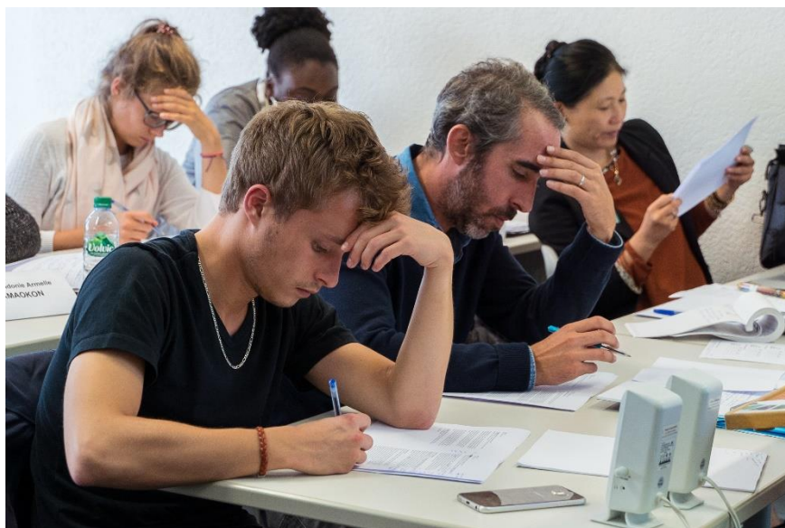
septembre 2017.

Participants prenant connaissances d'un cas pratique, lors de la session de septembre.