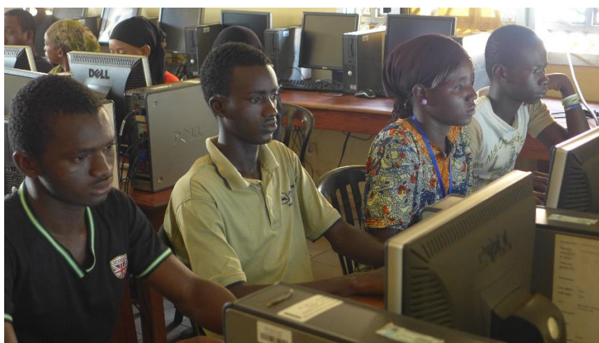
juillet 2017.

De plus, en partenariat entre ASF et le ministère de l'Éducation supérieure et de la Recherche scientifique est en cours, ce dernier permettrait d'équiper les étudiants d'ordinateurs.