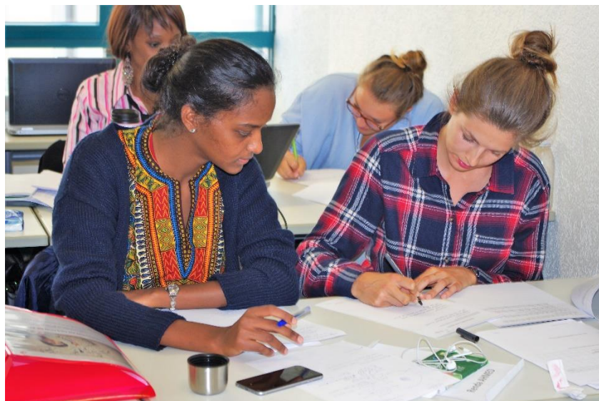
septembre 2017.

Participants travaillant sur un cas pratique, lors de la session du mois de septembre.