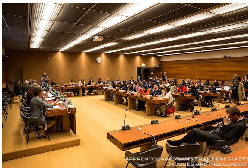
septembre 2017.

Side event lors du Conseil des Droits de l'Homme, septembre 2017.