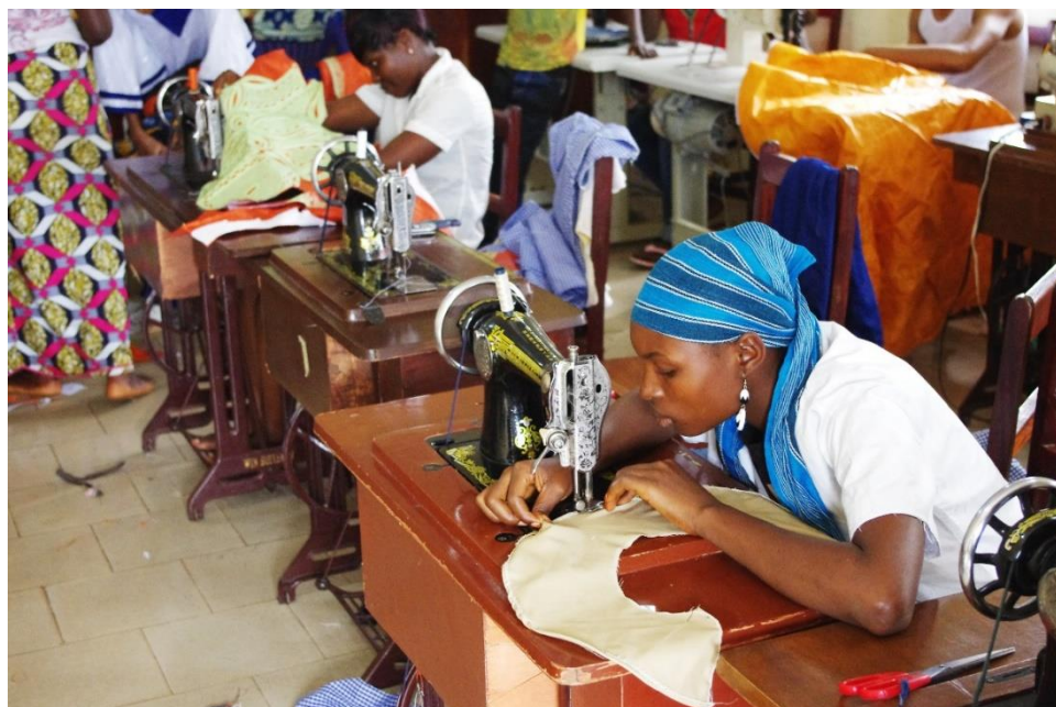
Atelier couture à Matoto en Guinée