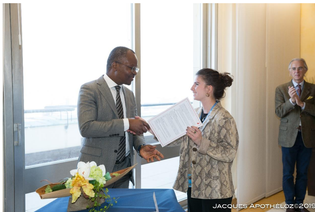
mars 2019

Les deux sessions organisées en 2019 ont regroupées un total de trente-deux participant-e-s (vingt femmes et douze hommes) de dix-sept nationalités différentes : Allemagne, Arabie Saoudite, Burkina Faso, Burundi, Canada, Congo RDC, Côte d'Ivoire, France, Guinée, Hongrie, Iran, Italie, Maroc, Sahraoui, Sénégal, Suisse, Togo.